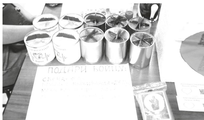
Благотворительная ярмарка в поддержку защитников Отечества в п. Новоселье