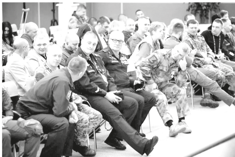
Участники Ассоциации ветеранов специальной военной операции Ленинградской области

ОБЩЕСТВЕННЫЕ ОРГАНИЗАЦИИ ЛЕНИНГРАДСКОЙ ОБЛАСТИ ПОДДЕРЖИВАЮТ УЧАСТНИКОВ СПЕЦОПЕРАЦИИ И ИХ СЕМЬИ