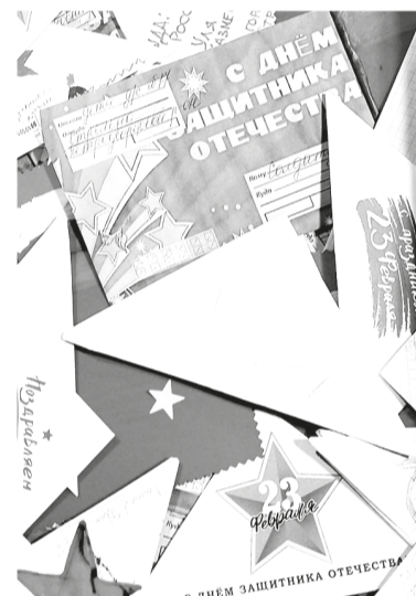
Письма бойцам от детей Ленобласти