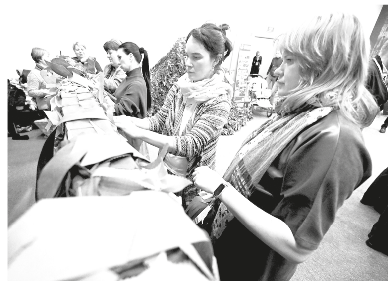
Женщины на мастер-классе по изготовлению маскировочных сетей