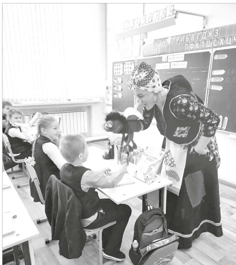
Театр «ЧЕМОДАНИЯ» в гостях у учащихся школы № 1